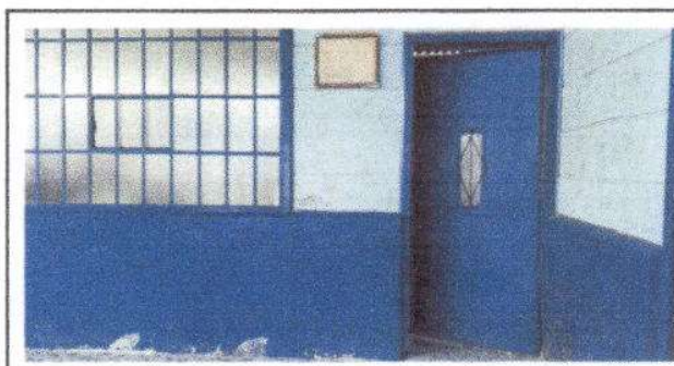
Foto 6: Fabricación e instalación de puerta de metal para módulo de aula.

Observación: Si es necesario se pueden agregar hojas adicionales y actualizar el número de hojas.