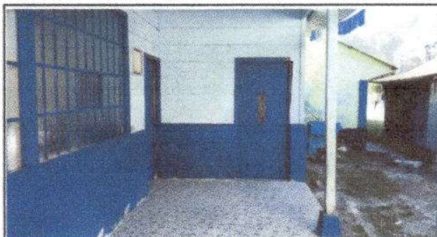
Foto 4: Sustitución de piso de torta de concreto por piso de cerámica.