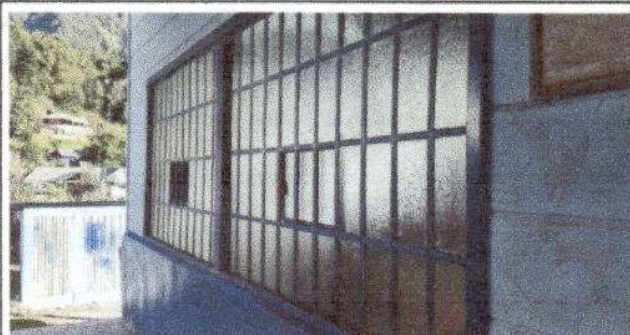
Foto 3: Sustitución de ventanas de madera por ventana de metal con vidrio.