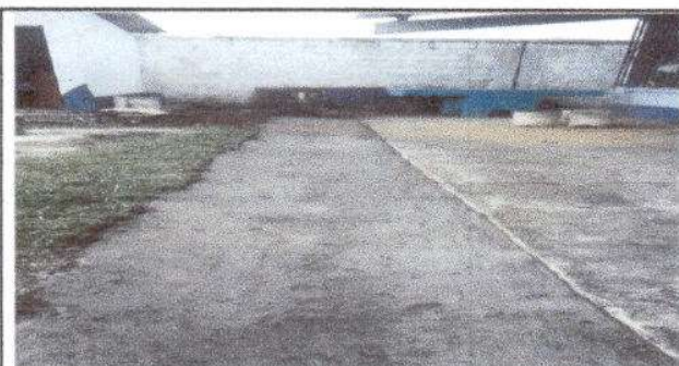
Foto 5: Sustitución de cuneta en terreno natural por cuneta de concreto.