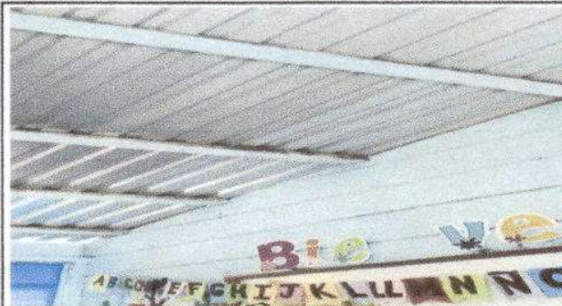
Foto 2: Sustitución de Capote de lámina para lámina troquelada, sustitución de elementos de fijación.