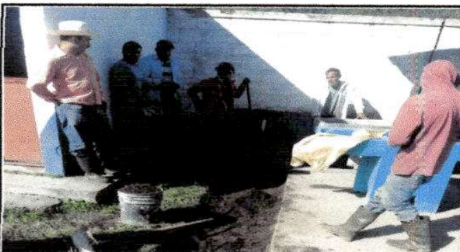
Foto 10: Sustitución de pila de concreto por pila de concreto de dos lavaderos fundidos.