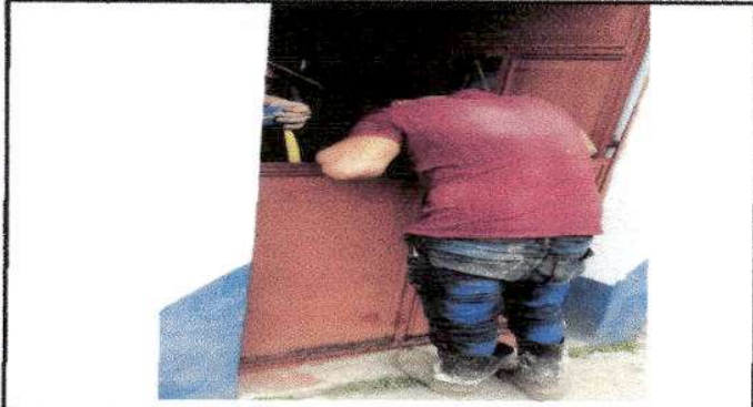
Foto 7: Fabricación e instalación de puerta de metal para modulo de cocina.