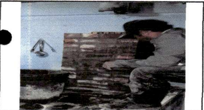
Foto 9: Sustitución de chimenea de concreto por chimenea de ladrillo.