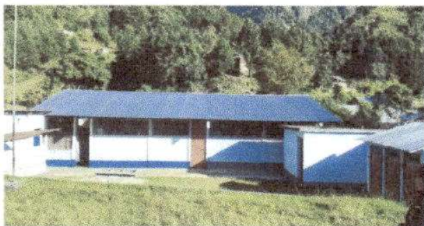
Foto 1: Sustitución de lámina por lámina troquelada Aluzinc calibre 26, sustitución de elementos de fijación.